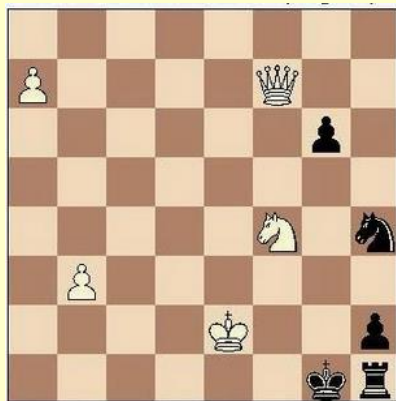
Mat v dveh potezah

Predmet je primeren tako za tiste učence, ki še nikoli niso igrali šaha, kot tudi za tiste, ki zanimivo šahovsko igro že poznajo.