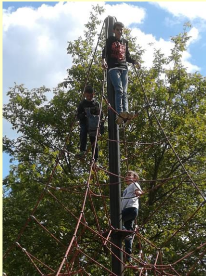
Strokovna ekskurzija, Celovec, Europapark, 1. 6. 2019

Učenci bodo v okviru pouka nemščine sodelovali tudi pri nemški bralni znački Epi Lesepreis . Lahko se bodo udeležili strokovne ekskurzije na koncu šolskega leta, ki jo organiziramo vsako leto, obiskali bomo enega izmed zanimivih avstrijskih krajev.