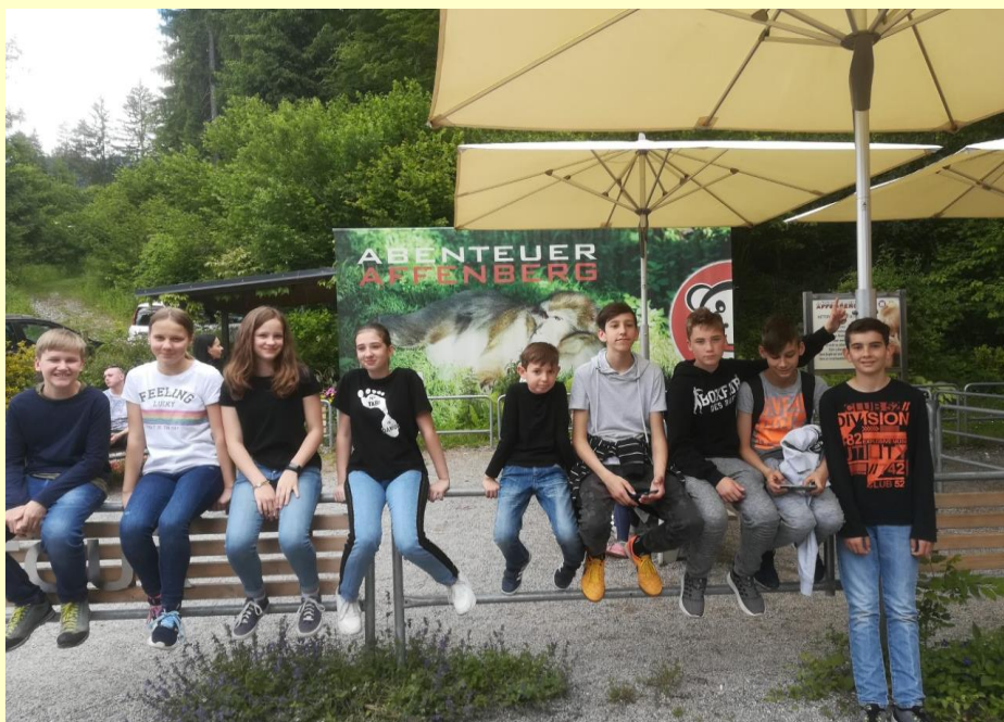
Strokovna ekskurzija, Affenberg (1. 6. 2019)

Če učenci na začetku šolskega leta izberejo tuji jezik, ga morajo obiskovati do konca šolskega leta.